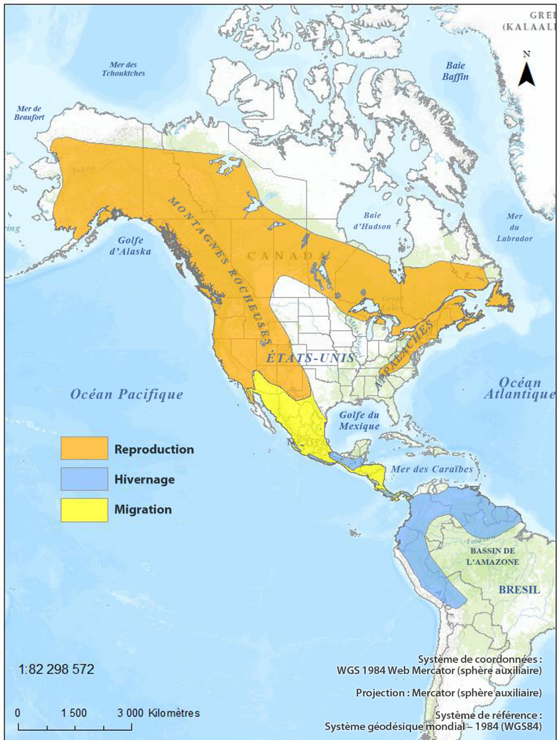
Figure 1. Répartition du Moucherolle à côtés olive en reproduction, en migration et en hivernage [adaptation de BirdLife International et NatureServe (2013), d'après les données de Haché et al. (2014) et eBird (2014)].